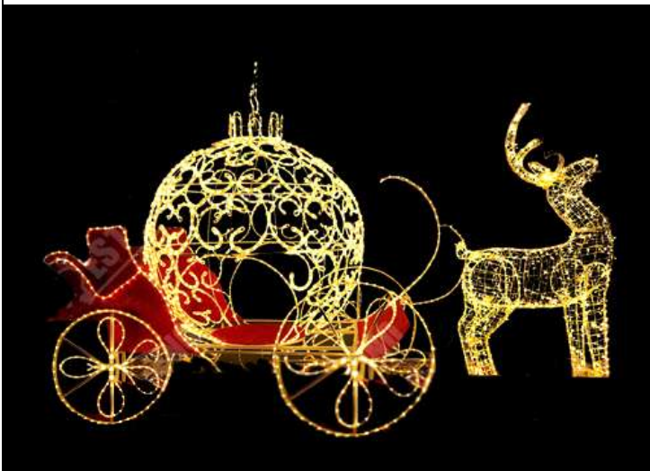
sasia 1 slite + 2 drere

240V, 100LEDS/10M/SET, lidhje seri me kellef dhe silikon ne cdo llampe , IP44, kabulli+3A CONVERTOR+IP44. Standarte per BE per perdorim te jashtem.